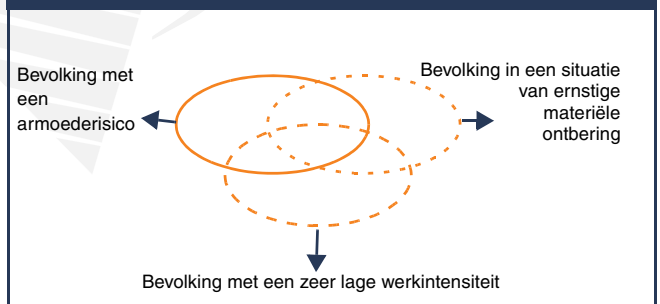
Figuur 1 - De bevolking met een risico op armoede of sociale uitsluiting

De bevolking met een risico op armoede of sociale uitsluiting bestaat dus uit verschillende segmenten, die te kampen hebben met één, twee of drie aspecten van het multidimensionele armoedevraagstuk.